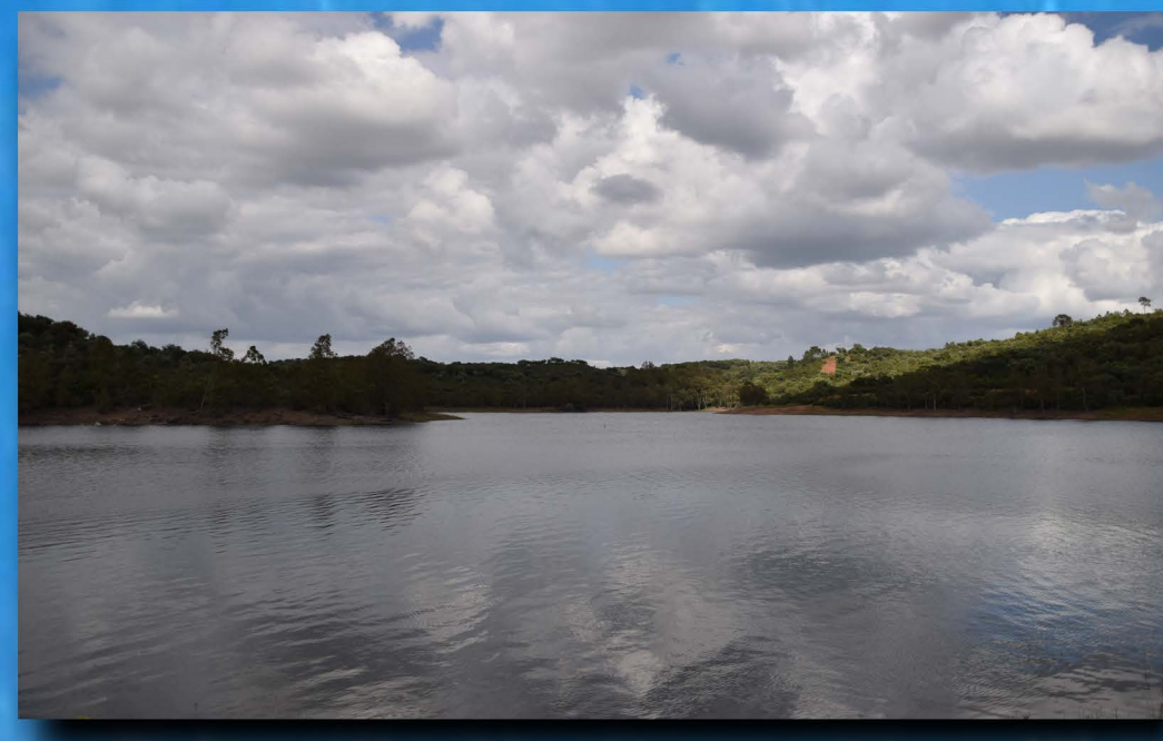
Embalse de Villar del Rey