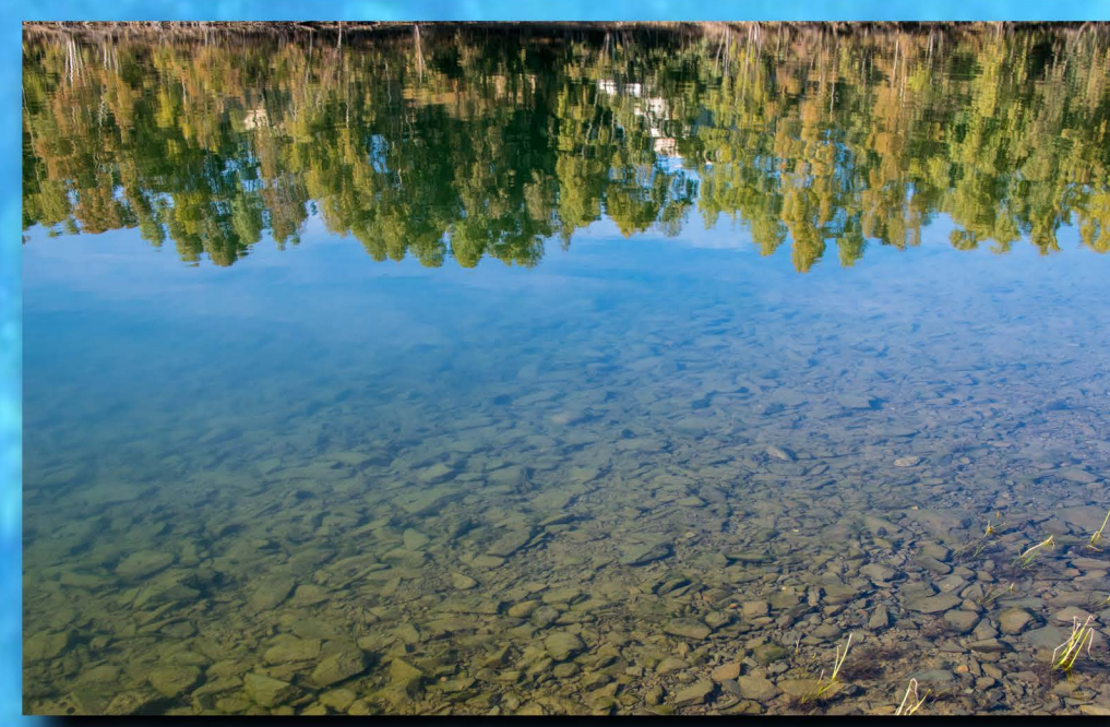
Isla del Zújar