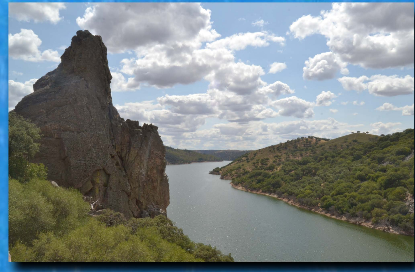
El Tajo a su paso por Monfragüe