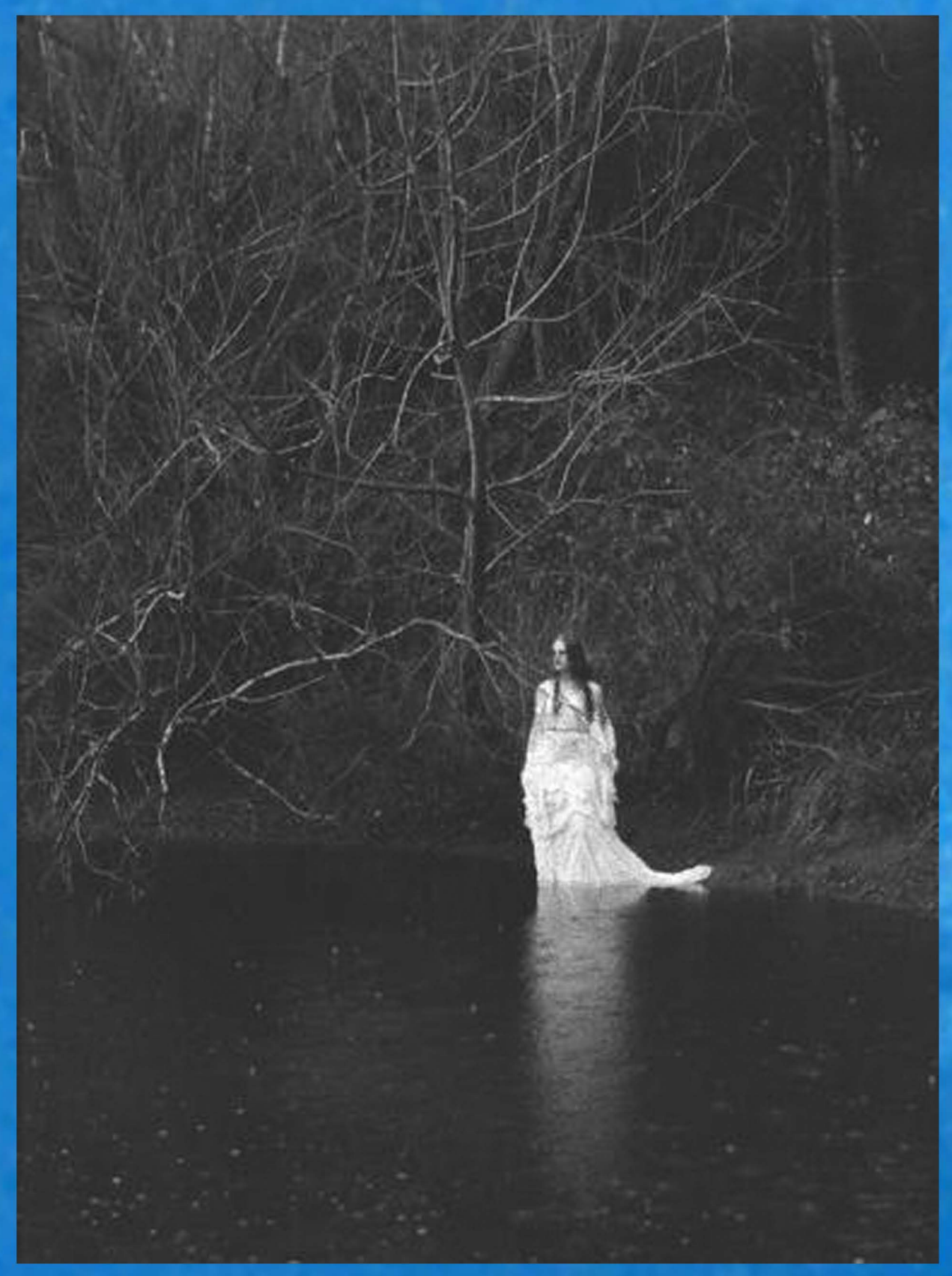
Representación de la Dama Blanca del Guadiana

LOS POZOS AIRÓN Los numerosos cultos politeístas que existieron con anterioridad a la implantación del cristianismo en la península, rendían culto a la Diosa Madre preindoeuropea y a todo lo que ella les ofrecía para su sustento. Muchos de estos cultos se centraban en los cursos del agua, donde habitaban los genios loci o genios del agua. Uno de los más importantes seres sobrenaturales vinculados al agua es Airón, dios hispano que se relaciona con las aguas profundas, así como con las simas, razón por la que se conecta también su figura con la idea del inframundo.