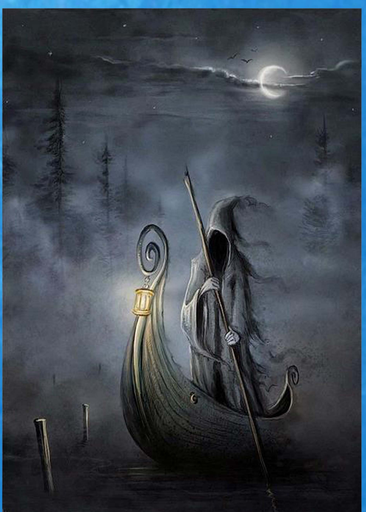
Representación del Barquero del Colmillo

Cerca del Tajo en soledad amena de verdes sauces hay una espesura, toda de yedra revestida y llena, que por el tronco va hasta la altura, y así la teje arriba y encadena, que el sol no halla paso a la verdura; el agua baña el prado con sonido alegrando la vista y el oído. Con tanta mansedumbre el cristalino Tajo en aquella parte caminaba, que pudieran los ojos el camino determinar apenas que llevaba. Peinando sus cabellos de oro fino, una ninfa del agua do moraba la cabeza sacó, y el prado ameno vido de flores y de sombra lleno. Movióla el sitio umbroso, el manso viento, el suave olor de aquel florido suelo. Las aves en el fresco apartamiento vio descansar del trabajado vuelo. Secaba entonces el terreno aliento el sol subido en la mitad del cielo. En el silencio sólo se escuchaba un susurro de abejas que sonaba. GARCILASO DE LA VEGA.