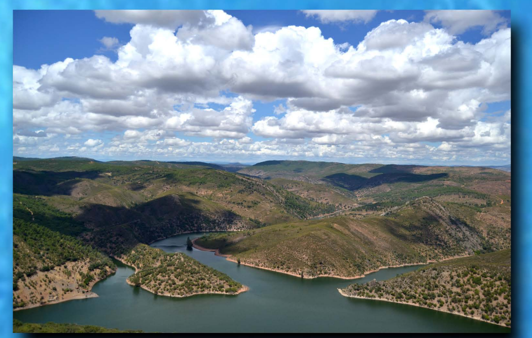
Parque nacional de Monfragüe

Río Duero, río Duero, nadie a acompañarte baja, nadie se detiene a oír tu eterna estrofa de agua. Indiferente o cobarde la ciudad vuelve la espalda. No quiere ver en tu espejo su muralla desdentada. Tú, viejo Duero, sonríes entre tus barbas de plata, moliendo con tus romances las cosechas mal logradas. Y entre los santos de piedra y los álamos de magia pasas llevando en tus ondas palabras de amor, palabras. Quién pudiera como tú, a la vez quieto y en marcha, cantar siempre el mismo verso pero con distinta agua. Río Duero, río Duero, nadie a estar contigo baja, ya nadie quiere atender tu eterna estrofa olvidada, Sino los enamorados que preguntan por sus almas y siembran en tus espumas palabras de amor, palabras. GERARDO DIEGO